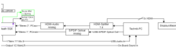
02-uebersicht Pa Monitor Stand 10-2024.drawio